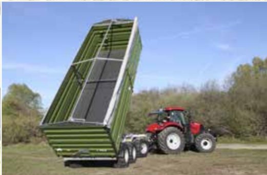
DDK 240 ponyvatarakóval