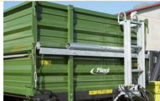
Opcionális: erős kivitelű oldalfeszítő rugó