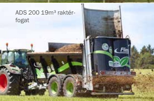
ADS 200 19m 3 raktér- fogót

A lehordó láncsal ellentétben itt nincs gyorsan kopó alkatrész