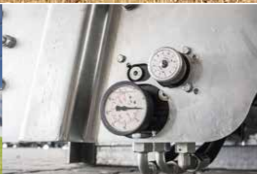
Mechanikus letolásszabályozással alapkivitelben.