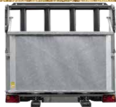
Opcionális: takarólemez és zsilip ADS 60-nál