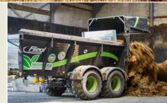
Az ADS opcionálisan 800 mm-es nagy rakodótér hátfallal felszerelhető és szállító pótkocsiként használható