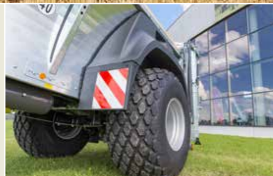
Opcionális: 40km/h -ás kivitel sárvédővel ADS80 / ADS100 / ADS120 esetén