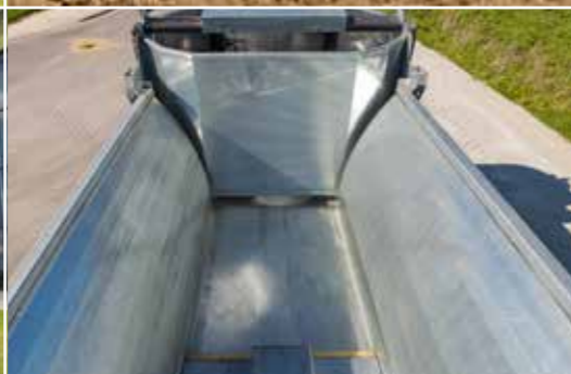
A hidraulikus letolórendszernek köszönhetően kisebb kopás - nem láncos lehordó