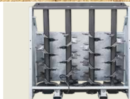
ADS 60 4db szóróhengerrel