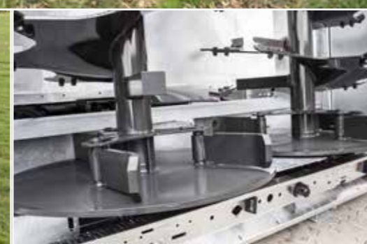
A teljesen horganyzott zsilip alapkvitelben