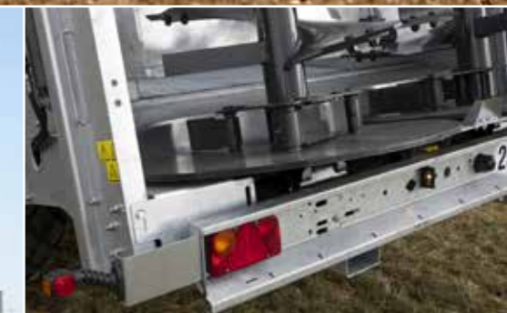
Lengő kidobó lapát