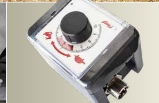
Opcionális: letolásszabályozás elektromos potenciométerrel